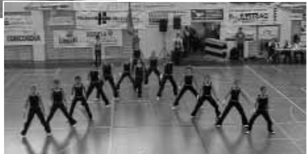
TA 2 an den Verbandsmeisterschaften in Neuenkirch (Verbandsmeistertitel)