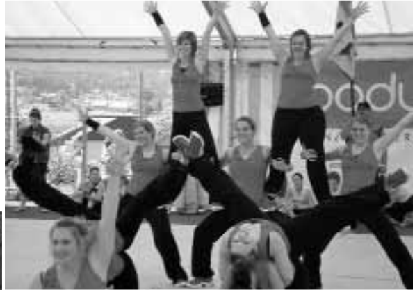
TA 1 am Gym-Day in Grosswangen

Nun ist es definitiv. Die Schweizer Meisterschaft im Aerobic wird im Jahr 2008 das erste Mal in Willisau durchgeführt. Der STV Willisau wird am 22./23. November 2008 diesen Aerobic-Anlass organisieren.