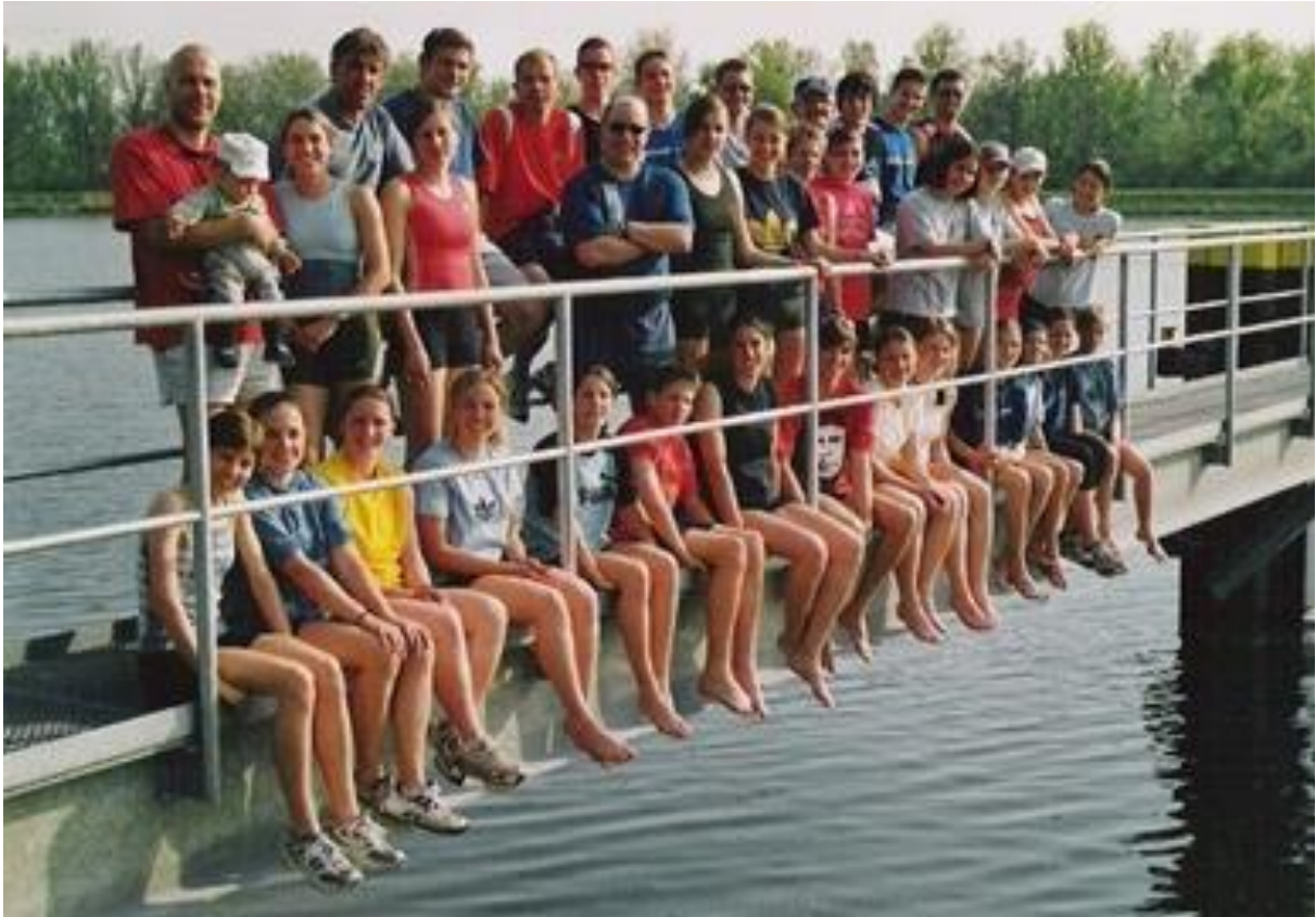
Trainingslager Breisach 2001