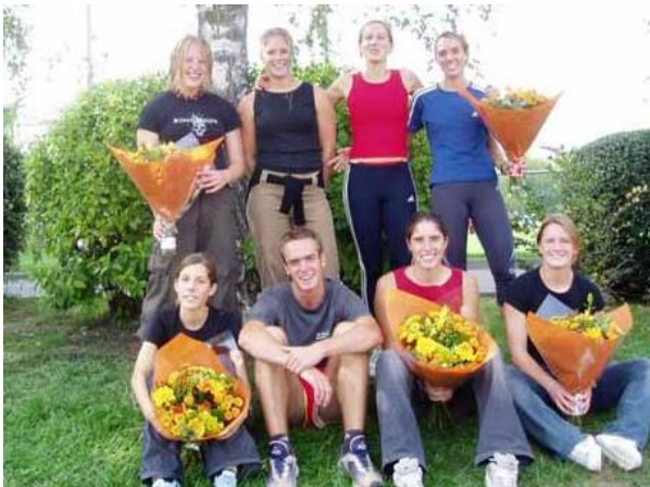
Medaillengewinnerinnen und Gewinner 2003