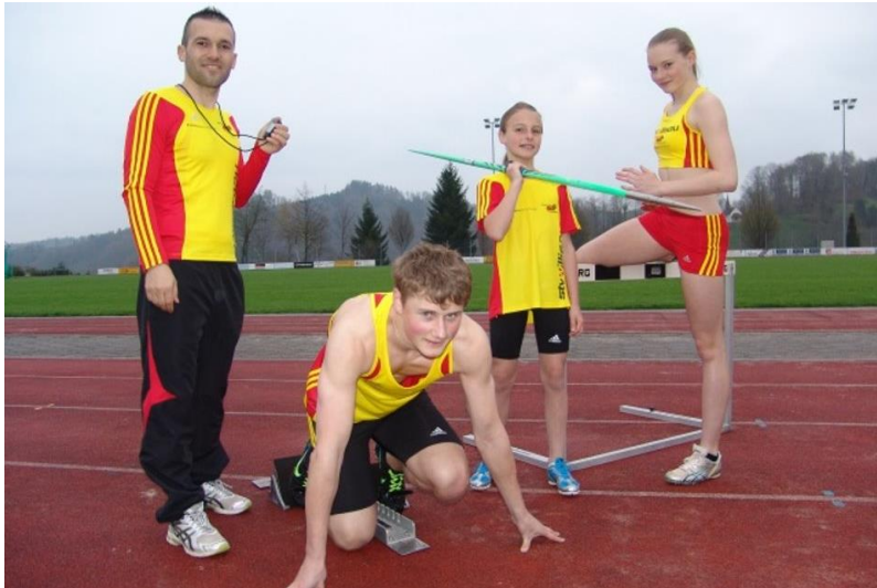
2013: LA im neuen Dress