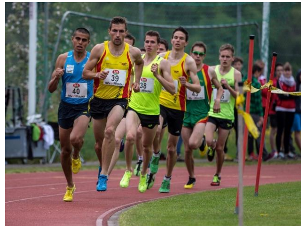
2015: Meeting Willisau