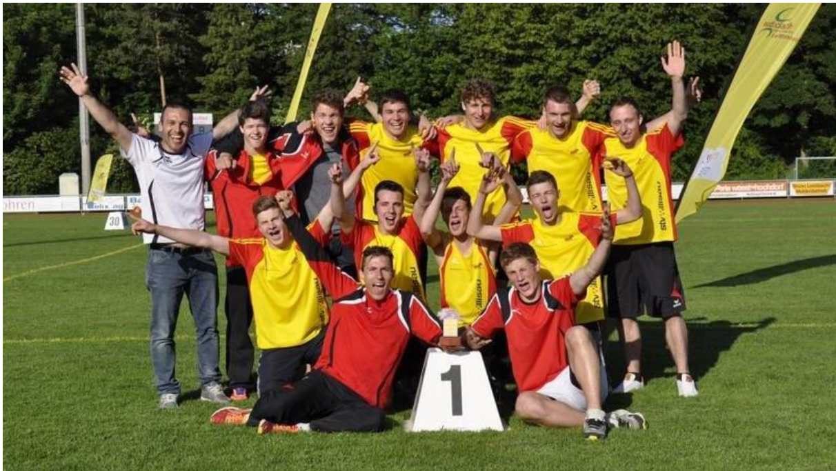
2014: Sieg am SVM 1. Liga