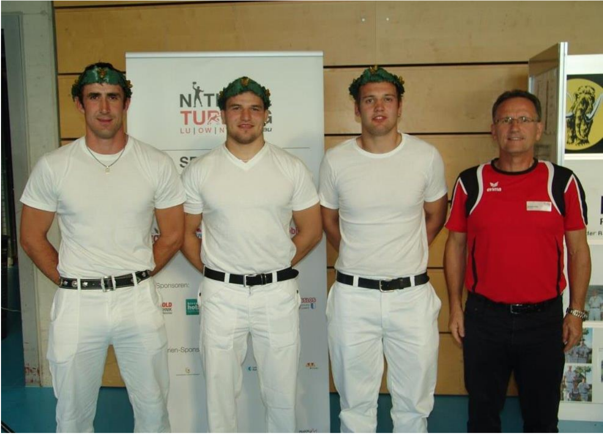
2014: Nationalturntage LU/OW/NW in Willisau